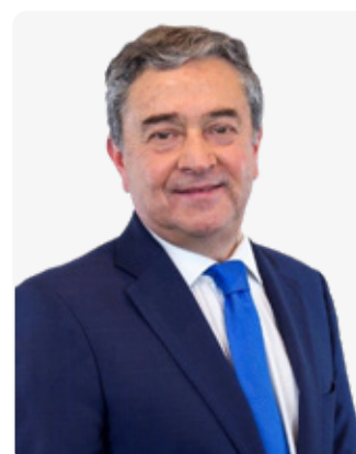
Juan Antonio Coloma Correa Director