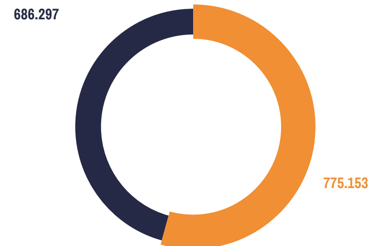
Ingresos 2023 M$1.461.450