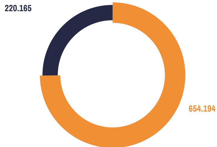
Ingresos 2022 M$874.359