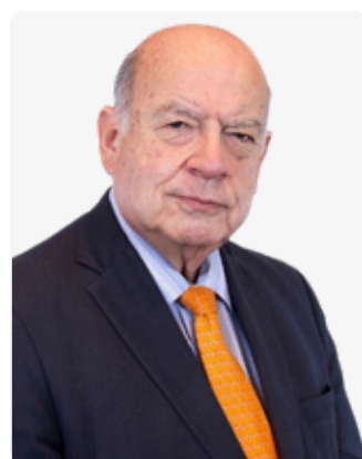
José Miguel Insulza Salinas Director