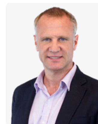
Felipe Kast Sommerhoff Director