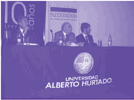
Seminario internacional “Violencia escolar: estrategias integrales de prevención. La experiencia nacional e internacional”.